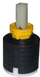
Kludi Mx, Objekta Mix